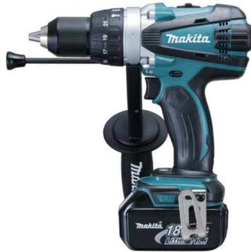
Imagen: DHP458RFE Modelos con terminación "Z" no incluyen baterías ni cargador.

Equipo Estándar: Puntas combinadas (2pz), gancho p/cinturón, porta puntas, empuñadura, varilla de profundidad.