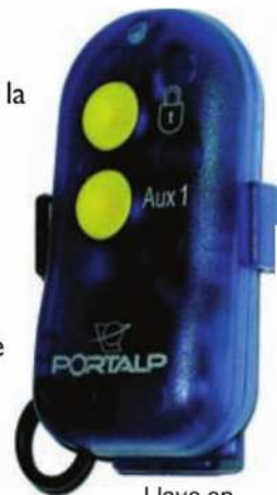
Llave en soporte

Cada puerta registra hasta 10 llaves, cada una puede ser invalidada en caso de pérdida o robo, y ser sustituida.