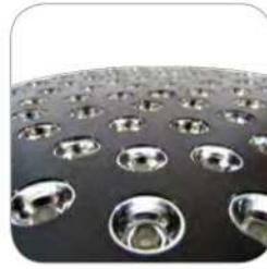
LEDs con reflectores individuales